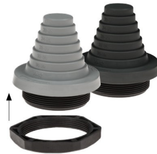
Dimensionen in mm: