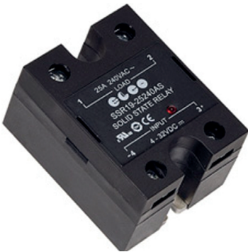
SSR19 - 25/40/60 A