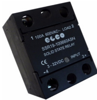
SSR19 - 80/100/125 A