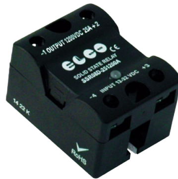
Dimensionen in mm: